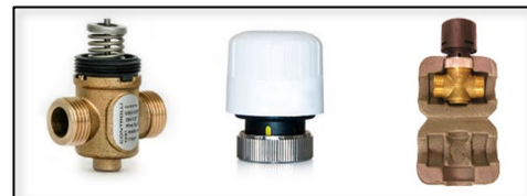
2-vägs ventilkit med ställdon