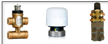
4-vägs ventilkit med ställdon