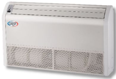
ACG Tak / Golv