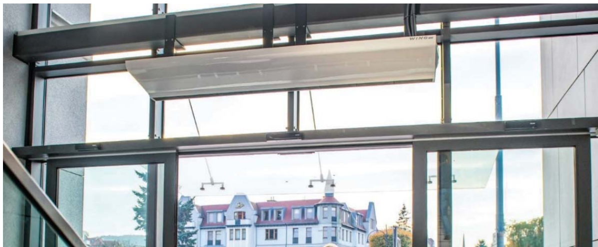
Wing W varmvatten · Wing E elvärme · Wing C utan värme